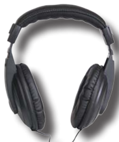
Casque confortable à forte atténuation de bruit

TRACAIR est fourni dans une mallette de transport avec tous les accessoires nécessaires.