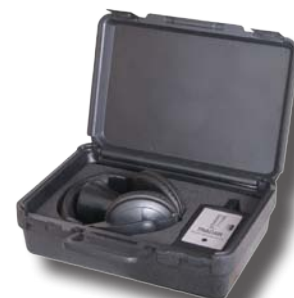
Valise de transport et de protection